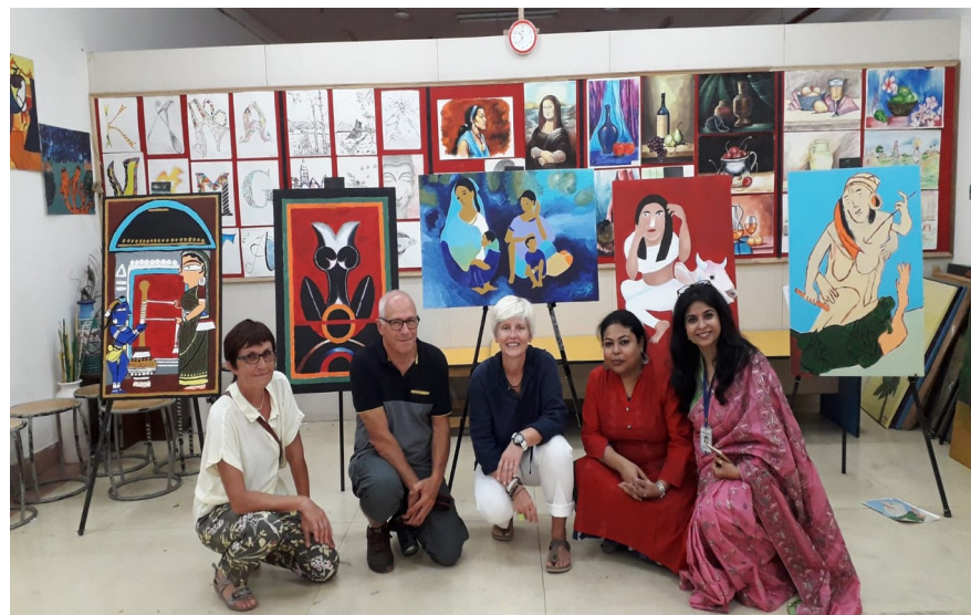
Peintures réalisées par les français. Professeurs d'art indien et nos accompagnateurs.