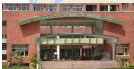
Delhi Public School Sushant Lok de Gurgaon, à proximité de NEW DELHI