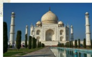
Le Taj Mahal à AGRA