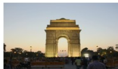
NEW DELHI, capitale de l'INDE